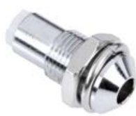
OPRAWKA LED 3 mm WYPUKŁA - METAL