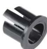
OPRAWKA LED 5 mm PŁASKA