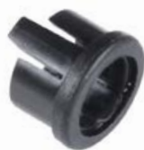
OPRAWKA LED 3 mm PŁASKA