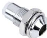
OPRAWKA LED 5 mm WYPUKŁA - METAL