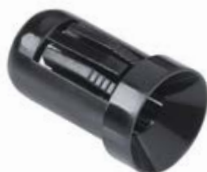
OPRAWKA LED 5 mm WKŁĘŚŁA