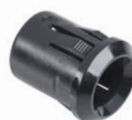
OPRAWKA LED 10 mm WYPUKŁA