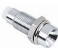
OPRAWKA LED 3 mm WKŁĘŚŁA - METAL