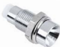
OPRAWKA LED 5 mm WKŁĘŚŁA - METAL