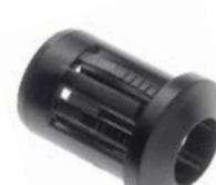
OPRAWKA LED 5 mm WYPUKŁA